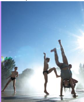
Terrasse rafraîchie avec brumisateurs ... Capacité 100 couv Dîner concert tous les vendredis soirs